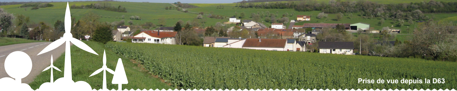
Prise de vue depuis la D63