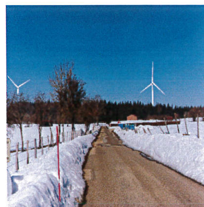
Photomontage du projet dans la forêt avec un des types de machines pouvant être installées pour ce projet.

Vendredi 16 juin de 14h à 17h00 et Lundi 26 juin de 14h à 18h00